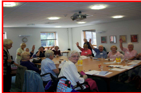
Dignity in Care Training