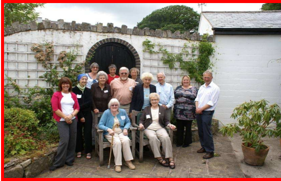
My life, my way exchanges